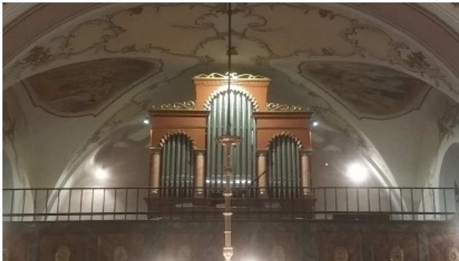
A felújított orgona